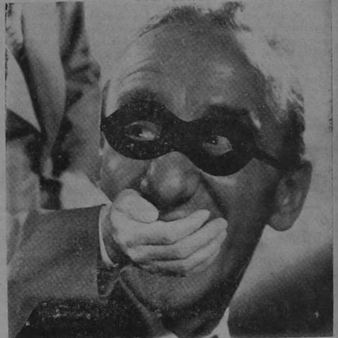
Junta la protesta airada ante el crimen, es una facultad para callar a la Junta de la Facultad...

Se nos informa que, con el beneplácito general, se le piensa dar un voto de simpatía a la Junta Directiva de la Facultad de Medicina... ¡Alabao sea Dios!